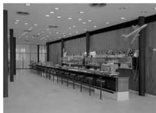
Lobby bar v 60. letech minulého století

Autoři projektu však pamatovali i na historii místa. Za druhé světové války tu bylo seřadiště Židů před nástupem do transportu, což upomíná reliéf na opěrné zdi pod hotelem.