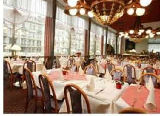
Rekonstrukce v 90. letech vnesla do hotelu zcela neadekvátní vybavení s ohledem na charakter stavby.