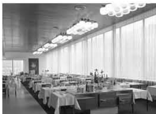
Restaurace v 60. letech minulého století

Minimalistická budova s moderní prosklenou fasádou a slunolamy měla na tehdejší dobu celou řadu technických vymožeností, například i dálkopis, což byla tehdy velká výjimečnost. Japonská společnost Mitsubishi Corporation si v hotelu pronajala apartmá a to sloužilo jako její pražská kancelář. Tehdy to bylo něco naprosto ojedinělého.