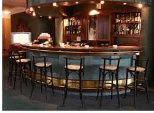
V 90. letech dostal zmenšený bar kulatý tvar s nižším stropem.