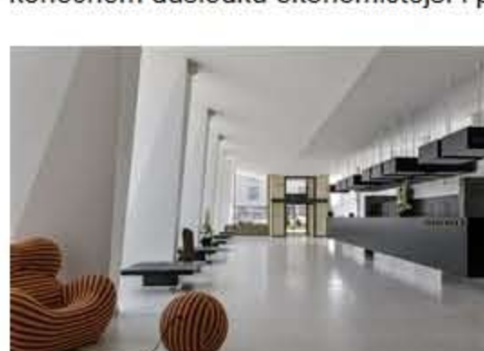
Recepce 2015 se výrazně přiblížila původní podobě.

V každém pokoji si už nyní hosté mohou individuálně nastavit teplotu, což je v konečném důsledku ekonomičtější i přátelštější k životnímu prostředí.