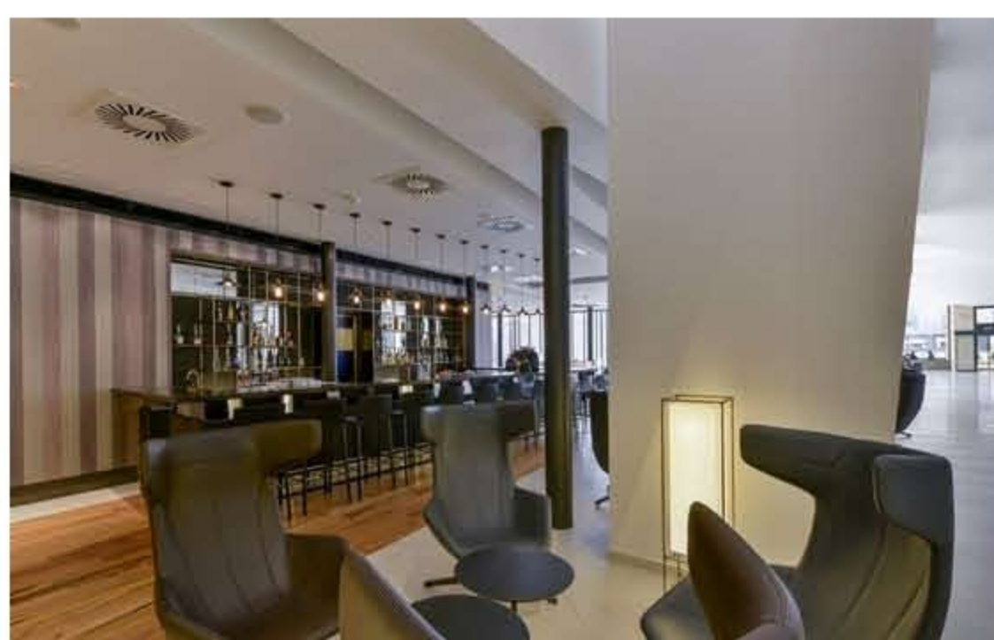
Lobby bar po poslední rekonstrukci zaplnily zejména ikony skandinávského a italského designu ladící s dobou vzniku hotelu.

Na vstupní podlaží i dnes navazuje terasa propojená schodištěm se zahradní plochou před hotelem. Hlavní vstup se skrývá za šikmými pilíři nesoucími ubytovací část. Pro vstupní část a recepci je typický strop, připomínající lodní kýl umístěný na podpůrných pilířích. Právě ten musela poslední rekonstrukce hodně „očistit“, aby opět vynikl.